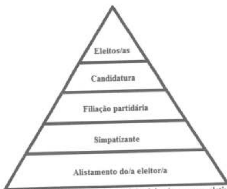
Figura 1: Escada de acesso da/o eleitor/a ao cargo eletivo

Nesta pirâmide podemos notar que o primeiro degrau é de se tornar eleitor. No caso brasileiro, grande maioria da população é votante, cerca de 141 milhões em 2014, numa população de 204 milhões (dados estimados pelo IBGE - Instituto Brasileiro de Geografia Estatística). O voto é obrigatório, com exceção dos menores de 18 anos e quem possui mais de 70 anos e analfabetos, para quem o voto é facultativo.