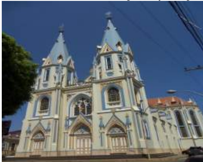
Foto 12: Matriz São Sebastião e sua magnífica arquitetura gótica.