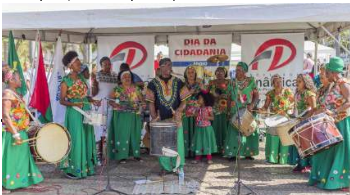
Foto 36: Apresentação cultural do Grupo Afro Ganga no evento social em Ponte Nova.