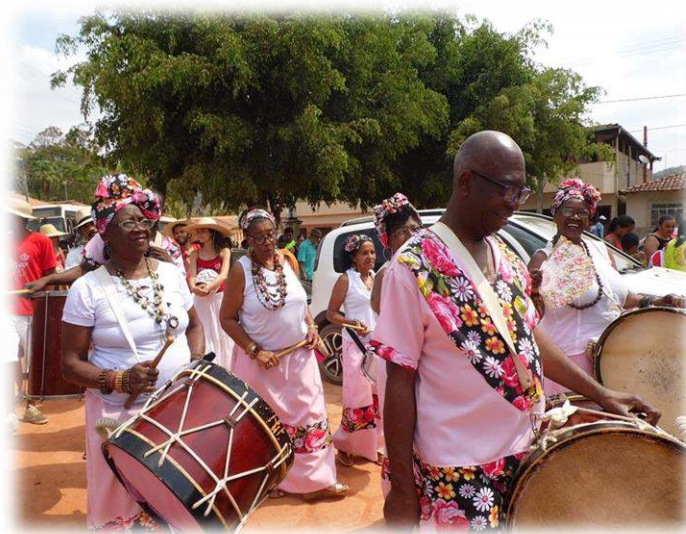
Foto 9: 129ª Festa de Nossa Senhora do Rosário, em Airões, Paula Cândido – MG.

Neste item apresentarei algumas considerações sobre identidade étnica, com base nas reflexões teóricas de Fredrik Barth.