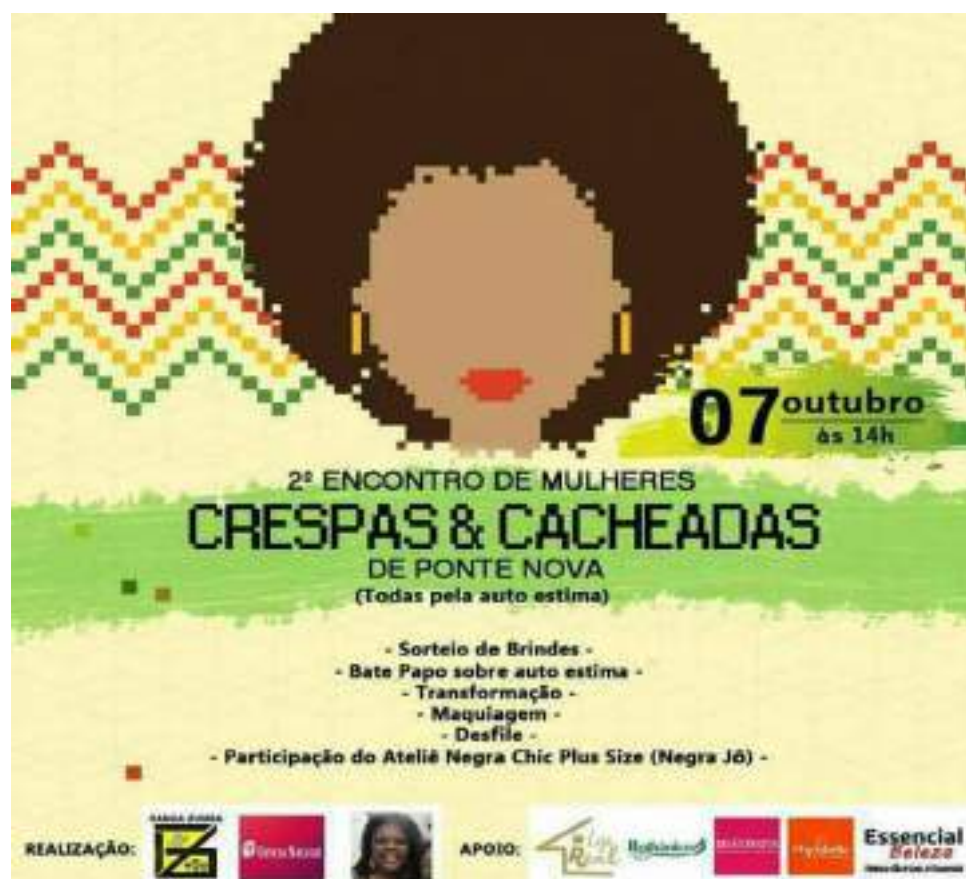
Foto 28: Foto de divulgação da 2ª edição do Encontro de Mulheres Crespas e Cacheadas de Ponte Nova.