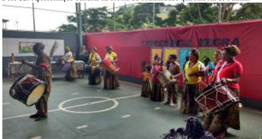
Foto 32: Apresentação cultural na escola da comunidade quilombola de Fátima.