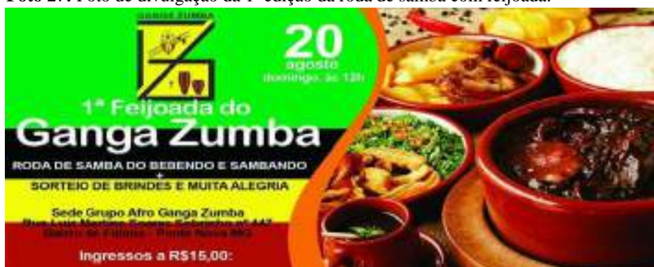
Foto 27: Foto de divulgação da 1ª edição da roda de samba com feijoada.