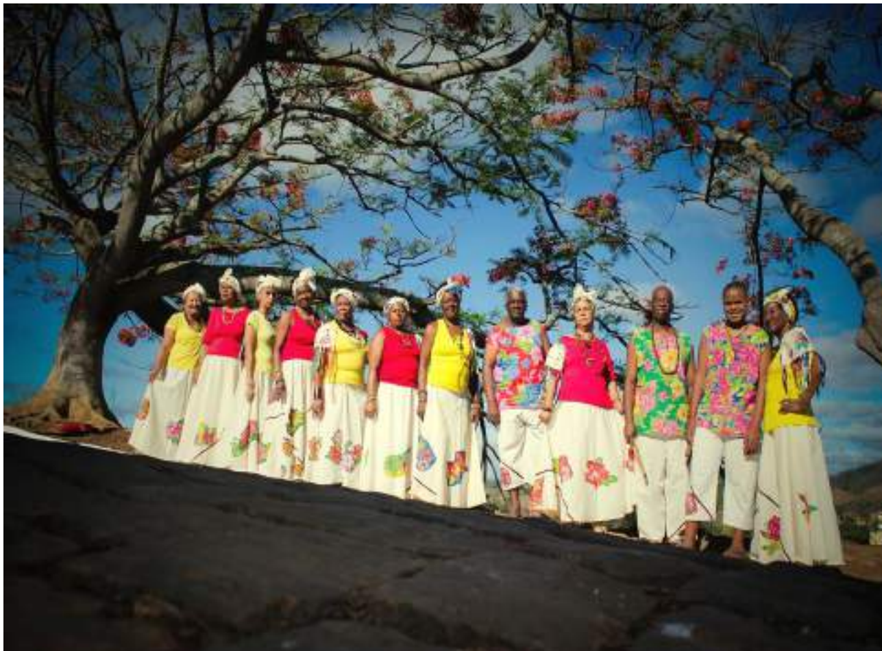
Foto 20: “Somos herdeiros de uma luta histórica, iniciada por muitos antes de nós.” (Luiza Bairros).